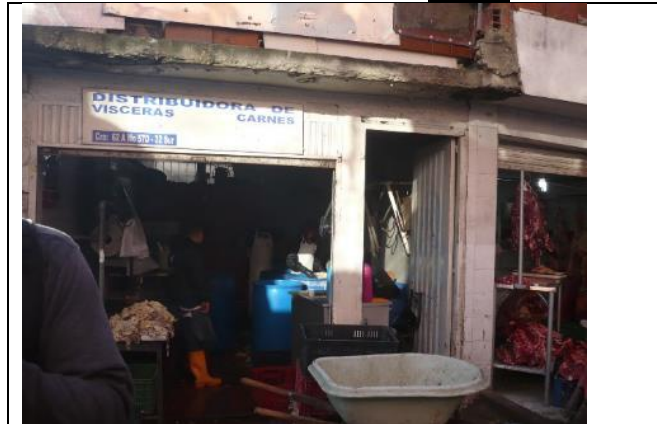
15. Carrera 62 A N° 57 D-32 Sur - AAA0052YJSK